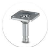
Pino Giratório com Placa Passador giratório con placa