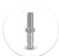
Pino Giratório com Rosca Passador giratória con rosca