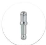
Pino Giratório com Anel de Retenção Passador giratório con anillo de retención