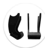
Alavanca de acionamento Leva de accionamiento

Comandos manuais devem ser adquiridos separadamente. Ver página 21. Mandos deben de ser adquiridos por separado. Mirar pagina 21.