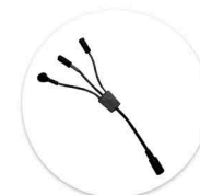
Cabo X p/ 3º atuador Cable X p/ 3º actuador

Eixos: Ø 25 mm Espessura mínima: 3,0 mm Distância entre eixos: 581 ± 2 mm