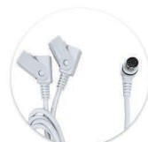
Cabo Y - DIN 13 Cable Y - DIN 13

*Comandos manuais devem ser adquiridos separadamente. Mandos deben de ser adquiridos por separado.