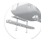
Pés de fixação MC 15 / MC 17 DB Pies de fijación MC 15 / MC 17 DB