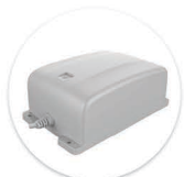
Bateria BP1 Bateria BP1