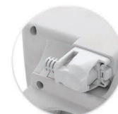
Cabo de Alimentação Plugável Cable del Alimentación Plugable