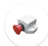
Botão de Emergência Boton de Emergencia