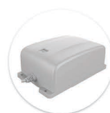
Bateria BP1 Bateria BP1