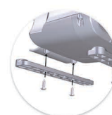
Pés de fixação MC 15 / MC 17 DB Pies de fijación MC 15 / MC 17 DB