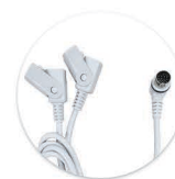
Cabo Y - DIN 13 Cable Y - DIN 13

*Comandos manuais devem ser adquiridos separadamente. Mandos deben de ser adquiridos por separado.