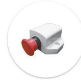
Botão de Emergência Boton de Emergencia