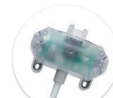
Luz Noturna Luz Nocturna