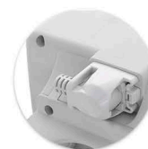
Cabo de Alimentação Plugável Cable del Alimentación Plugable