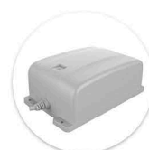
Bateria BP1 Bateria BP1