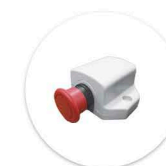
Botão de Emergência Boton de Emergencia

*Comandos manuais devem ser adquiridos separadamente. Mandos deben de ser adquiridos por separado.