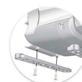
Pés de fixação MC 15 / MC 17 DB Pies de fijación MC 15 / MC 17 DB