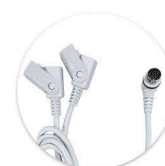
Cabo Y - DIN 13 Cable Y - DIN 13